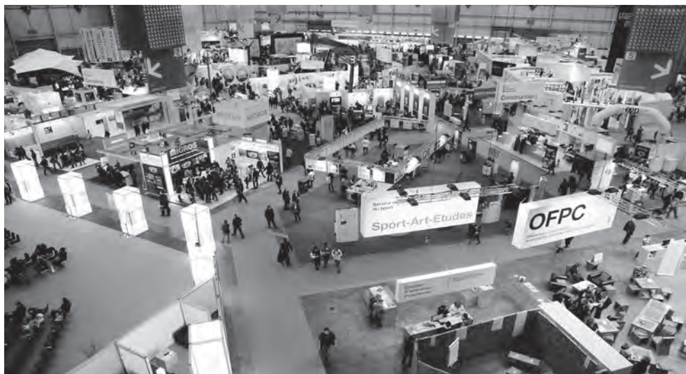
La Cité des métiers et de la formation, Genève

Institutions bénéficiaires des dons de la Loterie Romande (GE)